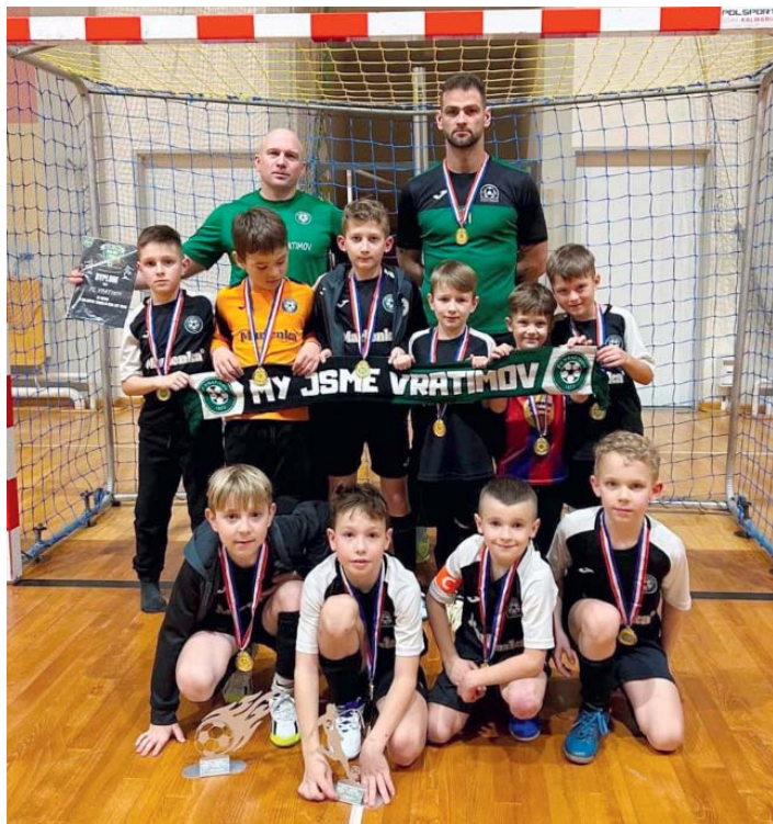
Bronz si z Polska odvezl tým U9.