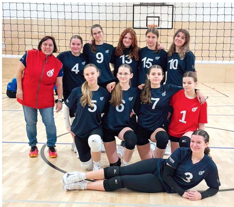
Družstvo kategorie U18Z.