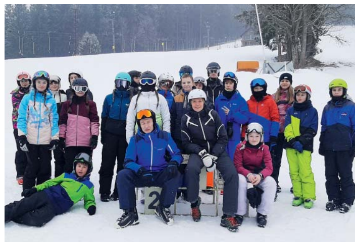
Společná fotografie účastníků lyžařské olympiády.

Soutěžilo se ve slalomu na lyžích zvlášť pro chlapce a dívky