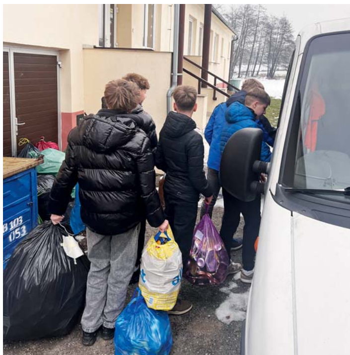
Žáci ZŠ Datyňská letos v lednu nasbírali 180 kg plechovek.