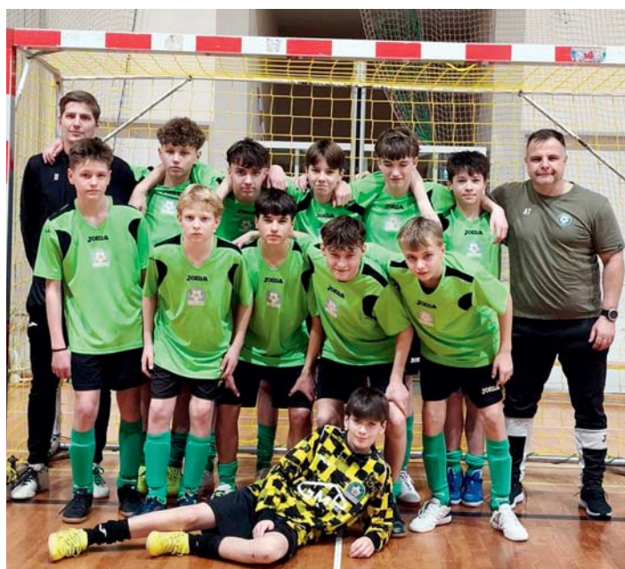
Hráči kategorie U15 obsadili 4. místo.