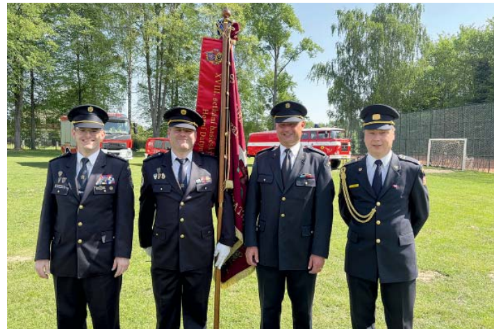
Oslavy 100 let výročí hasičského sboru.

Období sportovní sezony ubíhalo a následovaly soutěže s kvalitními výsledky, ale bednová umístění našim mládežníkům vždy