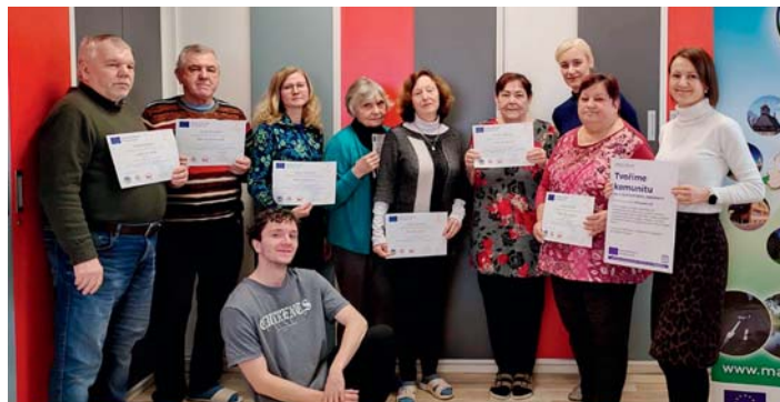
Absolventi kurzu Průvodce digitálním světem.

V roce 2026 se můžete těšit na kurzy focení mobilem, kurz Akademie zdraví, procházky po okolních obcích i nové nenáročné sporty (diskgolf, nordic walking) a v neposlední řadě i na seniorskou seznamku!