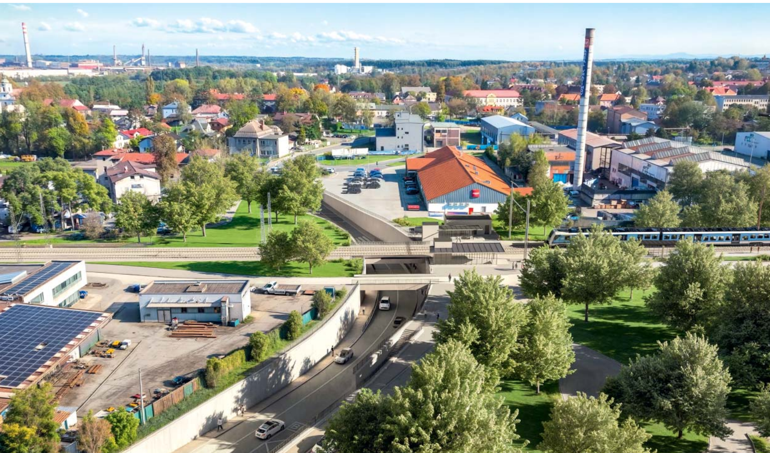
Vizualizace modernizace železniční trati a výstavba nového podjezdu ve Vratimově.