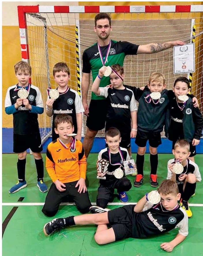
Mali fotbalisté v Porubě vybojovali 3. místo.