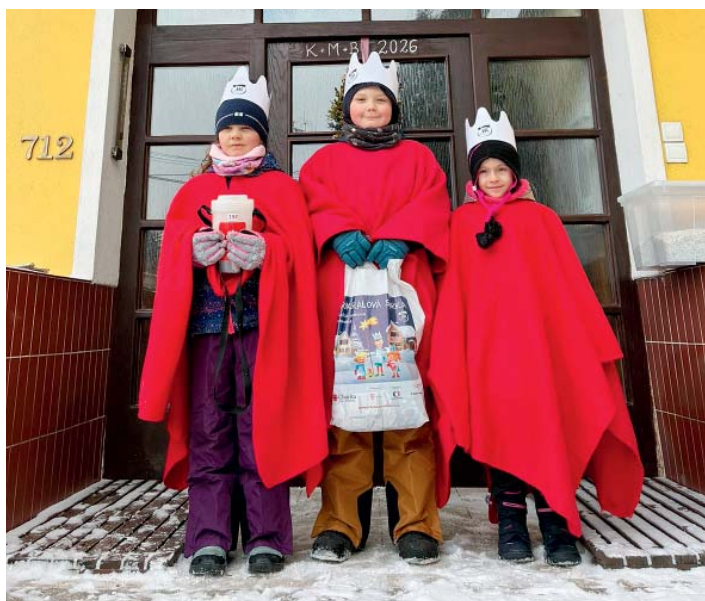
Koledníci Tříkrálové sbírky 2026.

Ve Vratimově a Horních Datyních se podařilo 11 skupinkám koledníků vykoledovat krásných 100 003 Kč . Poděkování patří všem, kteří do sbírky jakkoli přispěli, i těm, kteří se na její organizaci a průběhu podíleli.