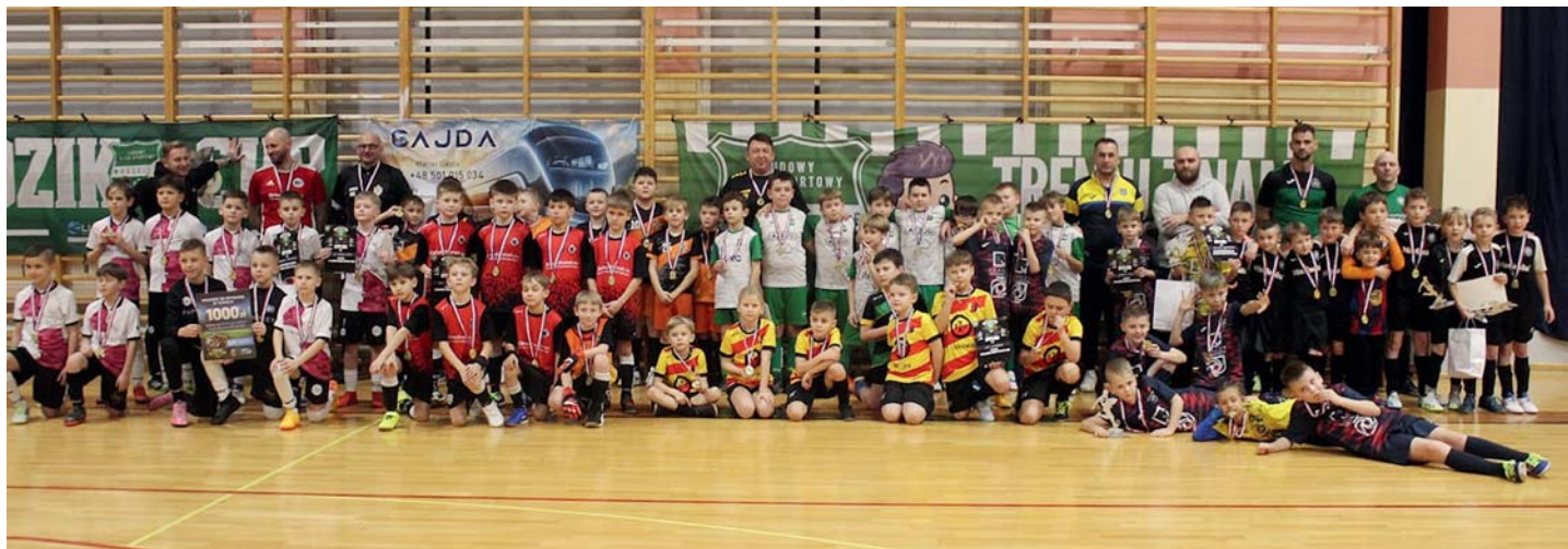
Dzik Cup 2026.