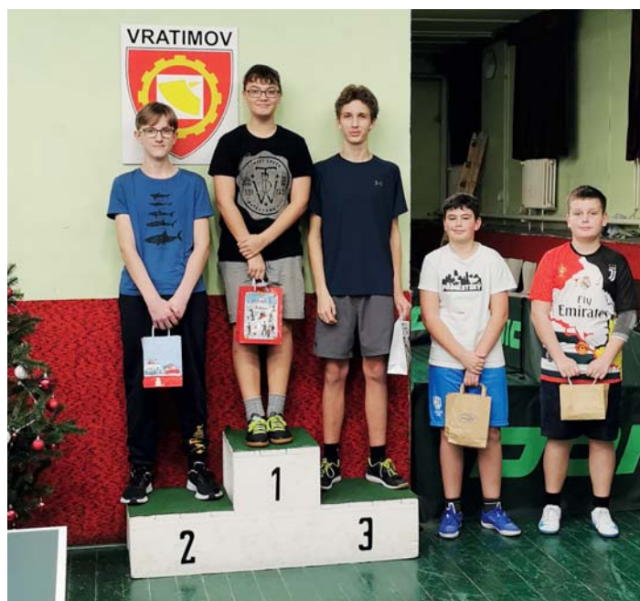
Hráči z kategorie neregistrovaní na stupních vítězů.