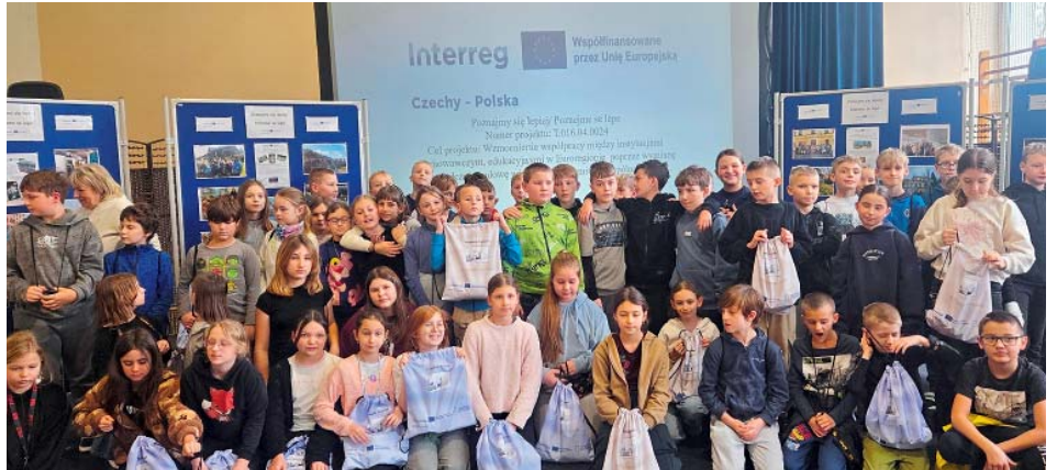
Skupinové foto v rámci projektu Poznejme se lépe .

Po workshopech následovala společná ochutnávka – žáci ochutnávali nejen své vlastní výrobky, ale také místní regionální speciality. Na závěr všichni obdrželi batůžky se svými výtvary a pochutinami jako vzpomínku na společně strávený den.