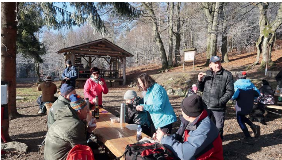
Turisté na výletě do Mostů u Jablunkova.

Následující lednový víkend proběhlo již druhé zimní táboření, tentokrát tradiční Miniškola na louce u chaty Prašivá. Beskydy nebyly zasněžené, ale protentokrát zaledněné, a kdo neměl pořádnou turistickou výzbroj (hlavně nesmečky), tak měl smůlu. Hudebníci to kupodivu zvládli na rozdíl od dopravní techniky i s nástroji. A protože tentokrát zazlobil chataře i kotel, tak provoz chaty Prašivé nakonec díky datyňským táborníkům (či raději drvoště-